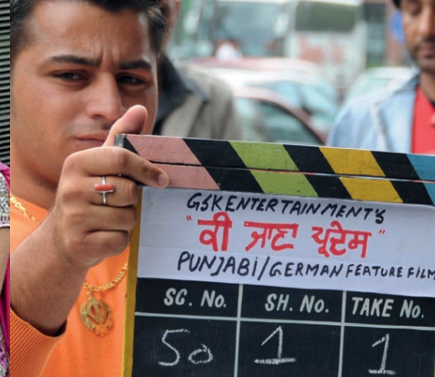
Dreharbeiten „Kin Jana Pardes“