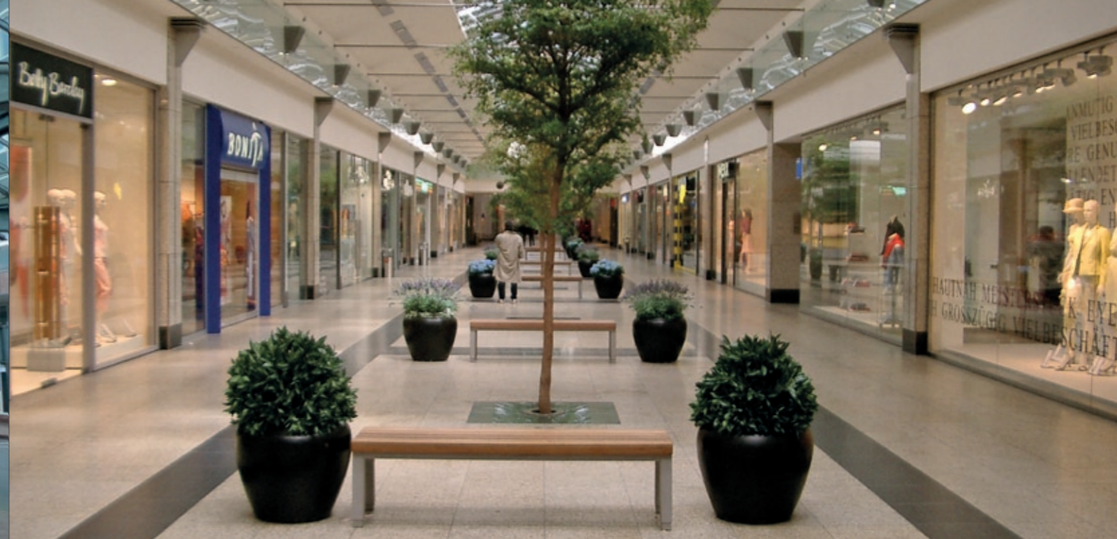
Rhein Neckar Zentrum