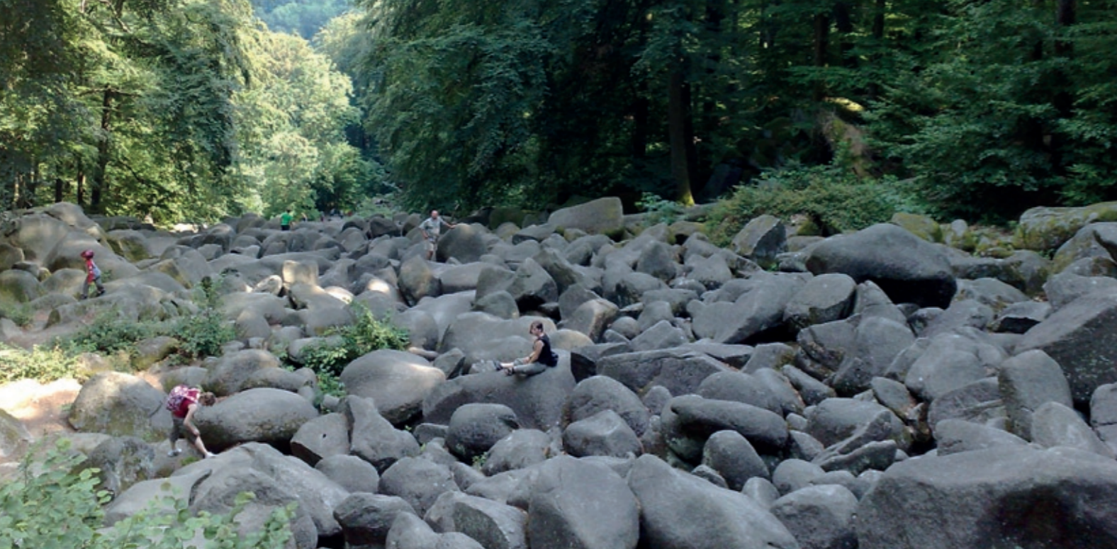
Felsenmeer im Lautertal Odenwald