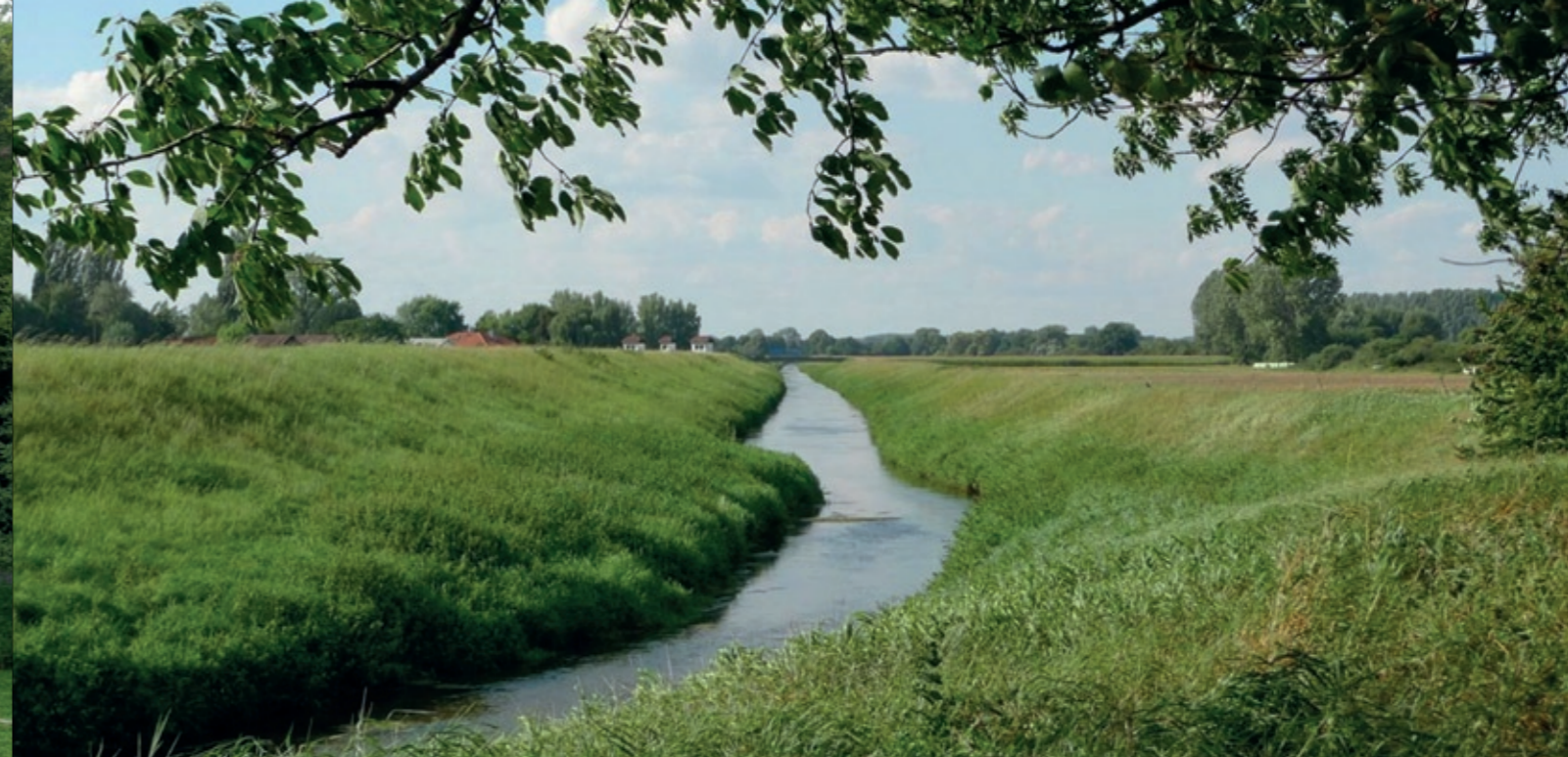
Landschaft Hessisches Ried