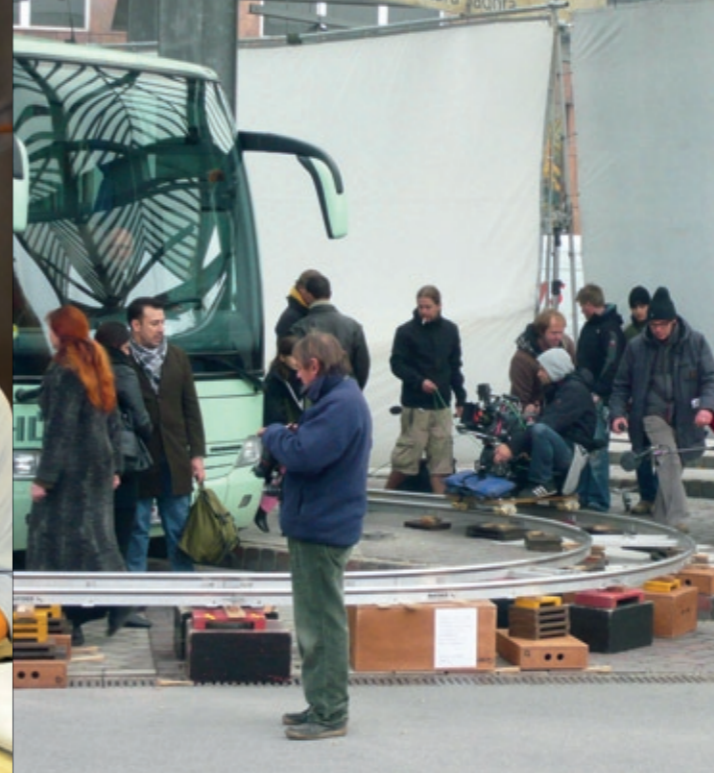
Dreharbeiten „Una vita tranquilla“ am Busbahnhof in Bensheim