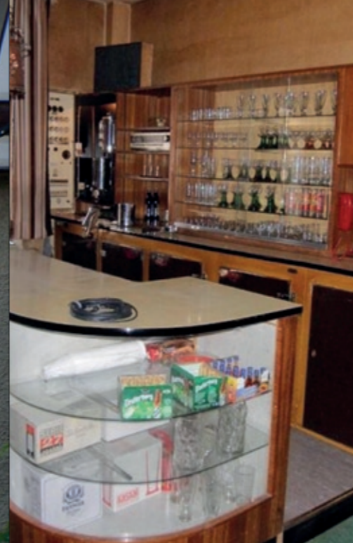
50er Jahre Kino Saalbau-Lichtspiele in Heppenheim