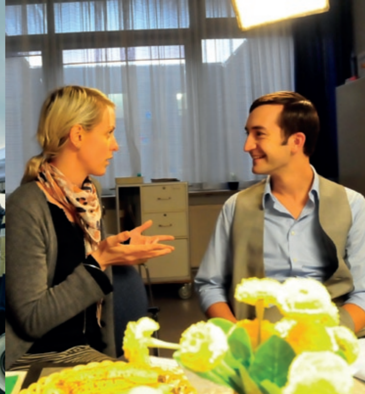
Dreharbeiten „Cindy liebt mich nicht“ im Heilig-Geist-Hospital in Bensheim